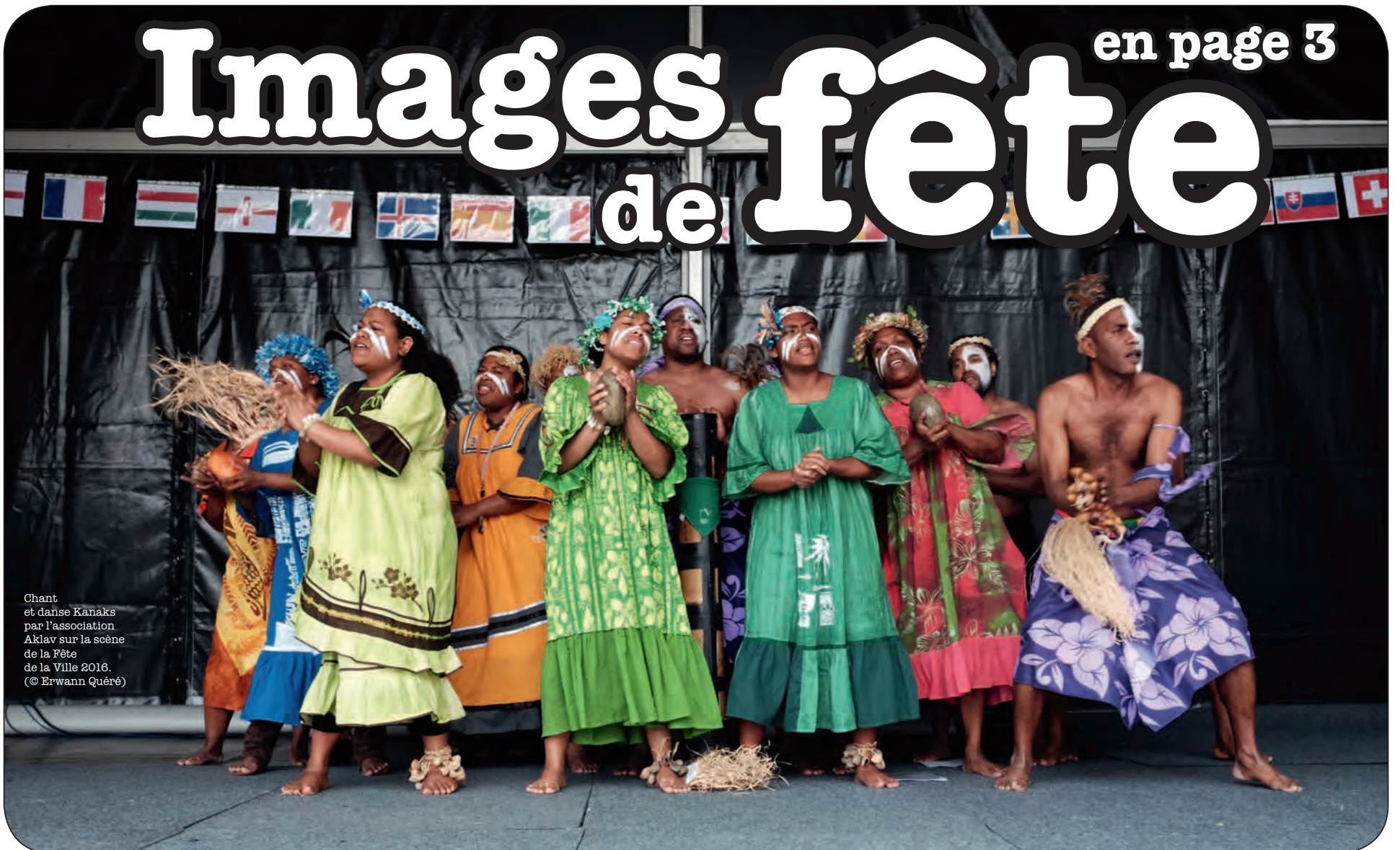
Chant et danse Kanaks par l'association Akiav sur la scène de la Fête de la Ville 2016.